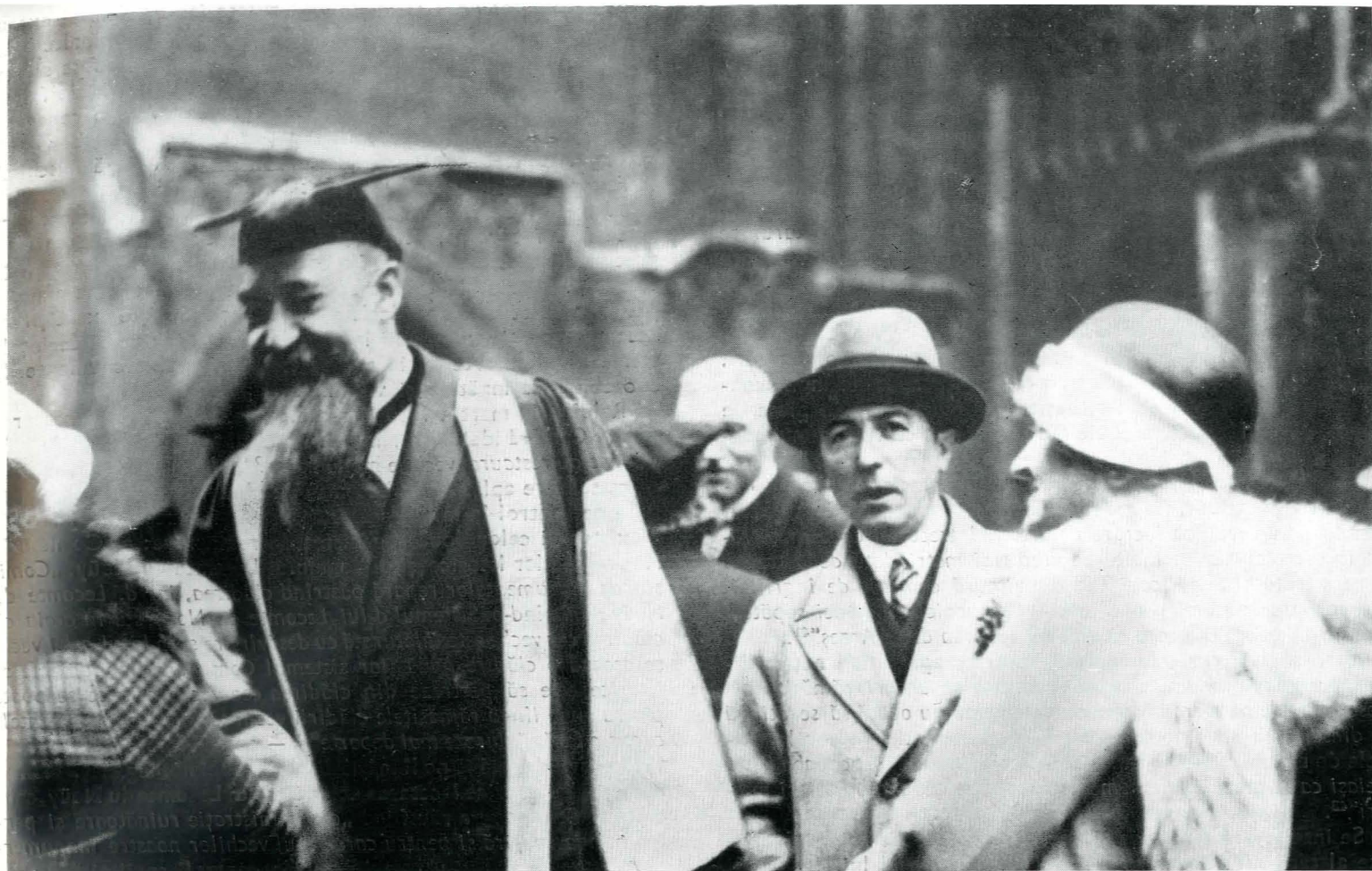
Nicolae Iorga la Universitatea din Oxford cu ocazia primirii titlului de Doctor Honoris Causa în anul 1930.